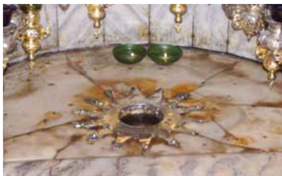
Der Stern in der Geburtskirche von Bethlehem